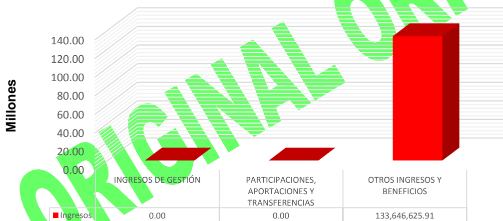
GRÁFICA 1 INGRESOS